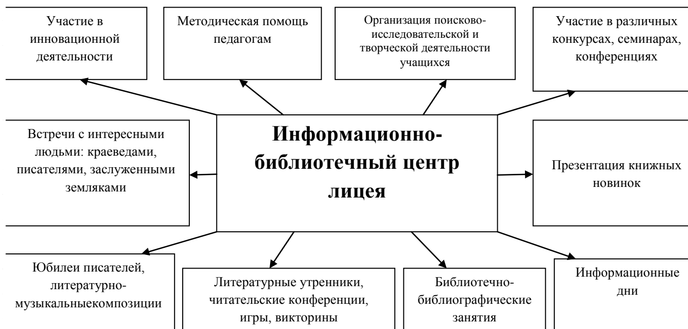
Схема работы ИБЦЛ

Создание в лицее информационно-библиотечного центра, который становится доступным для участников образовательных отношений, даёт возможность сделать эффективным процесс подготовки учащихся начального, основного и среднего уровней образования к участию в викторинах, конкурсах, конференциях и проектах. Внедрение в работу автоматизированной системы учёта библиотечного фонда позволит ускорить обслуживание читателей.